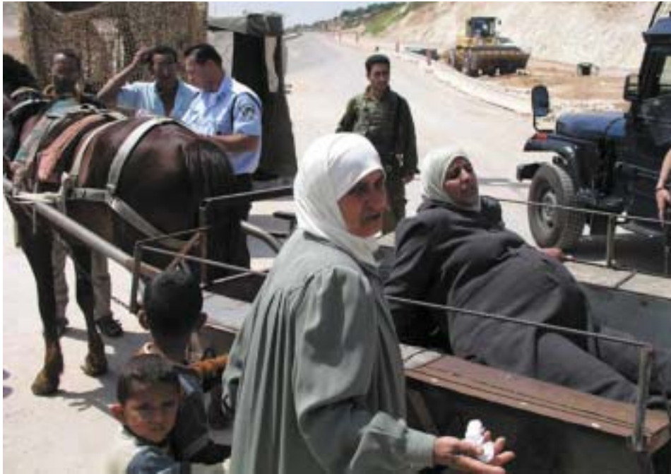
"אמבולנס" במחסום ג'זברה