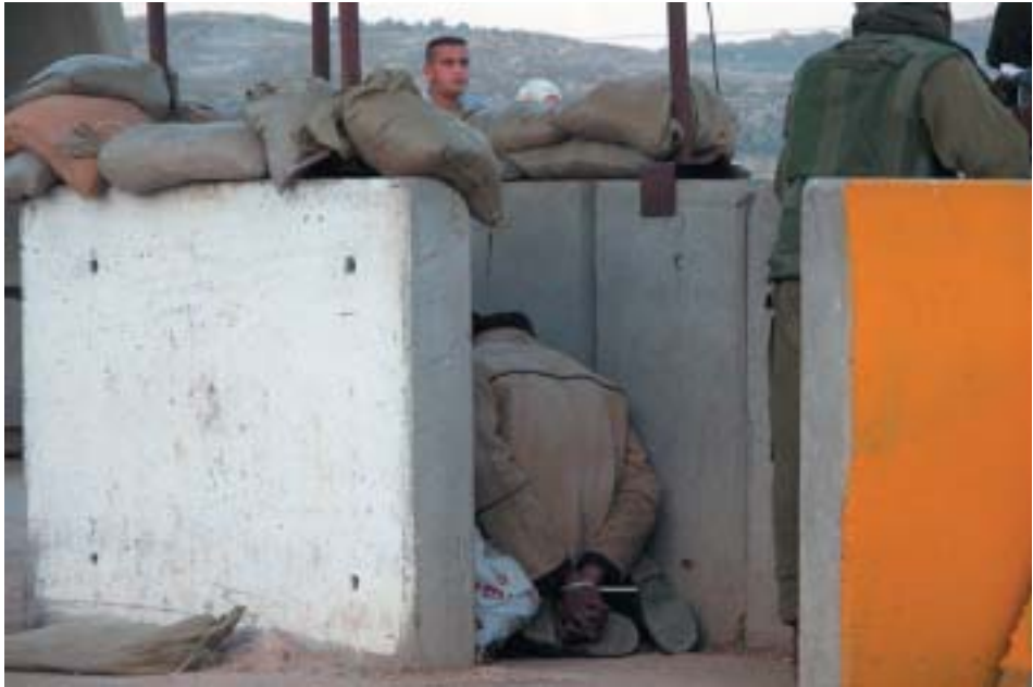
מחסום חווארה: כפות באזיקוני פלסטיק, בתא כליאה זעיר