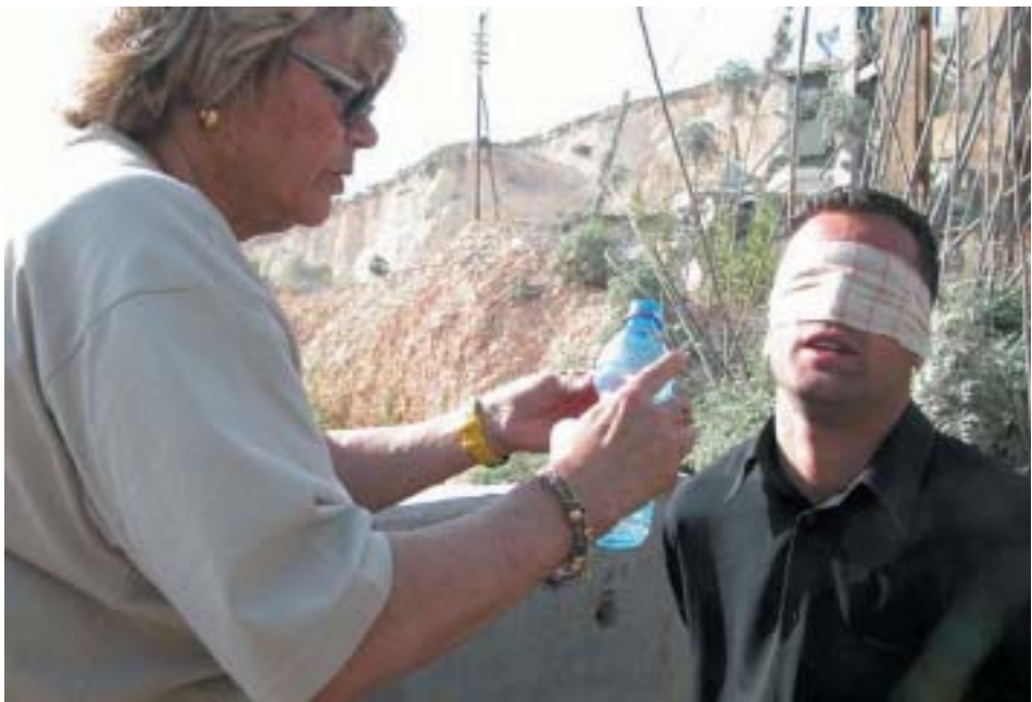
חברת מחסום Watch משקה אדם כפות