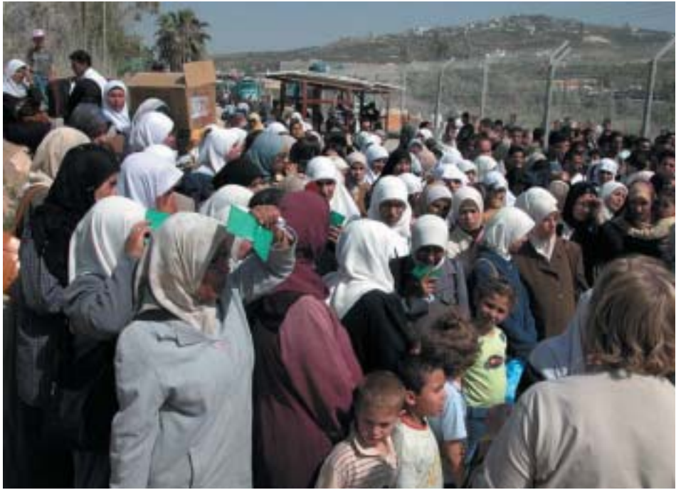
מחסום בית איבא: המתנה