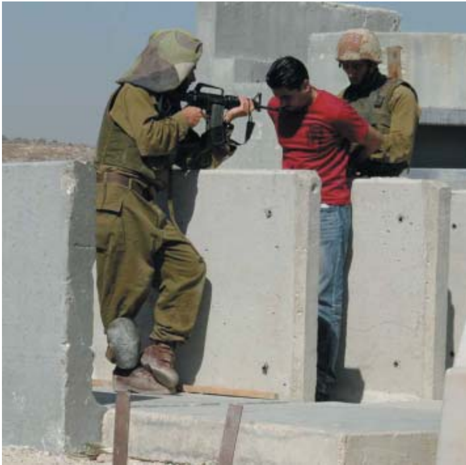
כפיתה ונשק שלוף