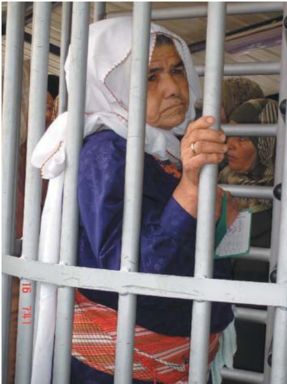
מחסום חווארה: קרוסלה – שער תקוע