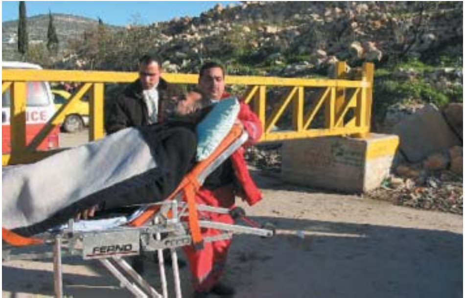
השער הסגור תמיד בענבתא. כדי להגיע לאמבולנס, החולה יאלץ לעבור מתחת לשער.