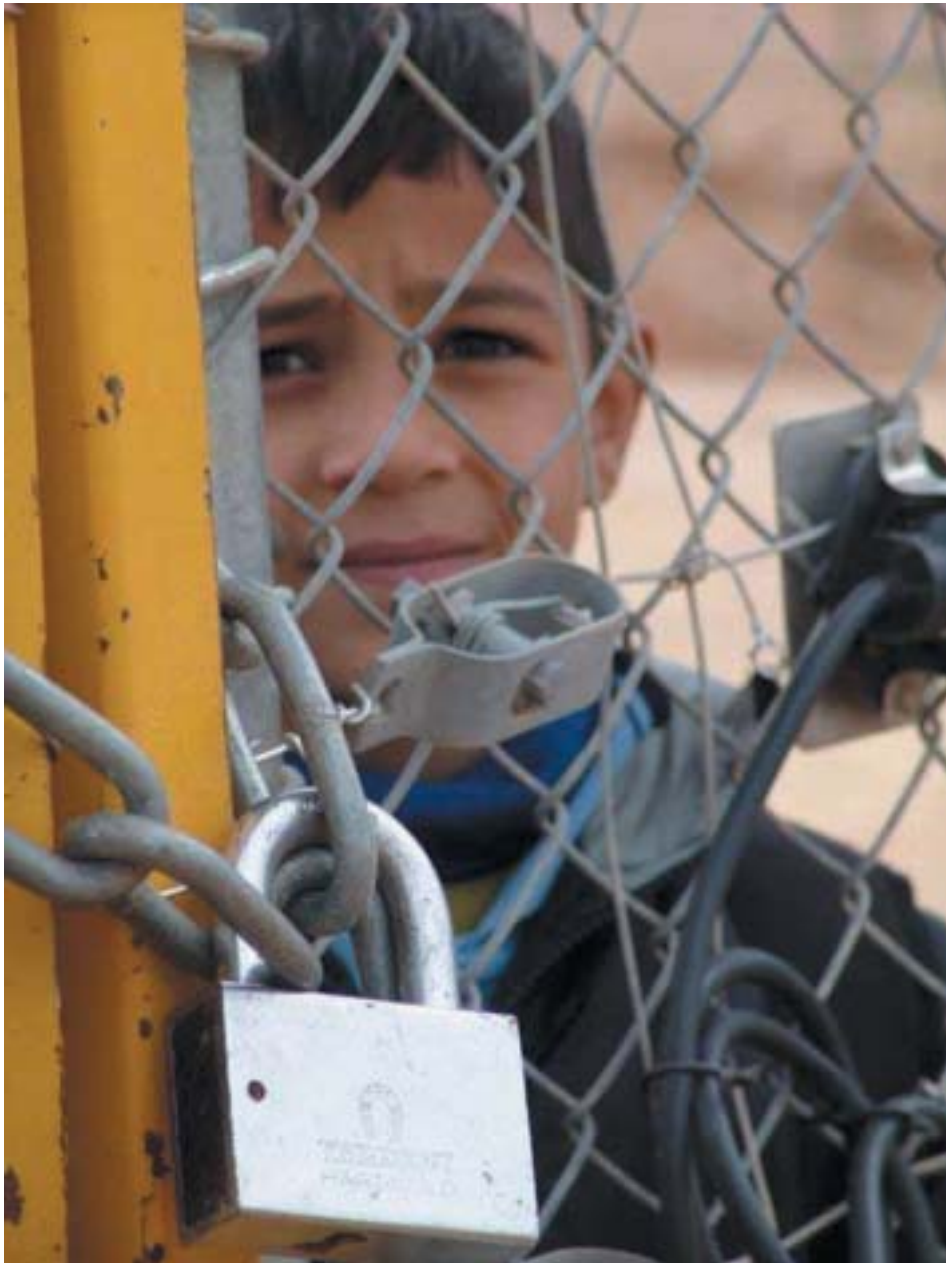
שער התלמידים בגדר ההפרדה, ליד חירבת ג'זברה