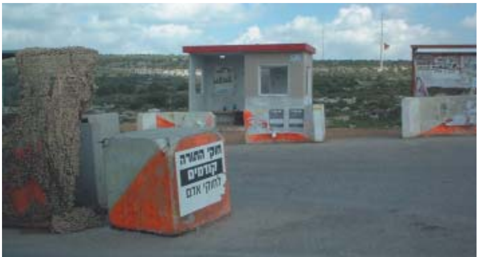
חוקי התורה קודמים לחוקי האדם, כתובת בצומת תפוח