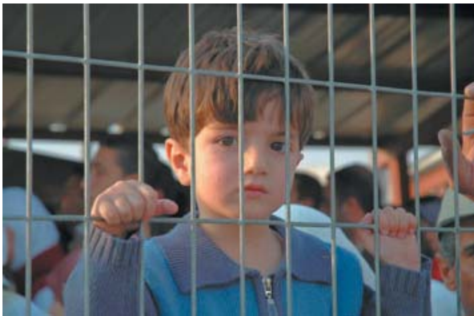
מאחורי הסורגים במחסום קלנדיה